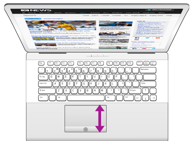
Questo è un touchpad