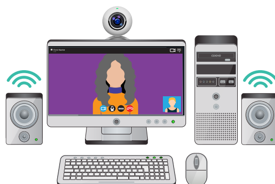
Што ви треба за водење видео разговори

Сите овие работи се вградени во мнозинството компјутерски апарати, вклучувајќи ги десктоп компјутерите, лаптопите, таблетите и умните телефони (smartphones). Меѓутоа, некои десктоп компјутери може да немаат вградена камера. Во тој случај може да купите интернет камера и да ја вклучите во вашиот десктоп компјутер. Исто така ви треба соодветна апликација.