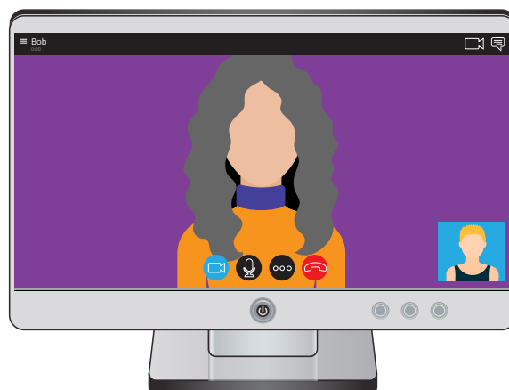
Видео разговор на Skype

За време на разговорот, сликата на соговорникот ќе го исполнува поголемиот дел од екранот. Вашето лице ќе го видите во мал квадрат во долниот дел од екранот. Така ќе знаете како ве гледа соговорникот.