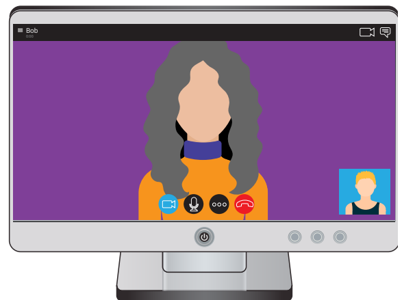
Gọi điện thoại có hình Skype

Trong suốt cuộc gọi, quý vị sẽ nhìn thấy mặt người quý vị gọi chiếm gần trọn màn hình. Quý vị cũng sẽ nhìn thấy khuôn mặt của quý vị trong một ô nhỏ ở bên dưới. Việc này là để cho quý vị biết mình trông như thế nào đối với người bên kia.