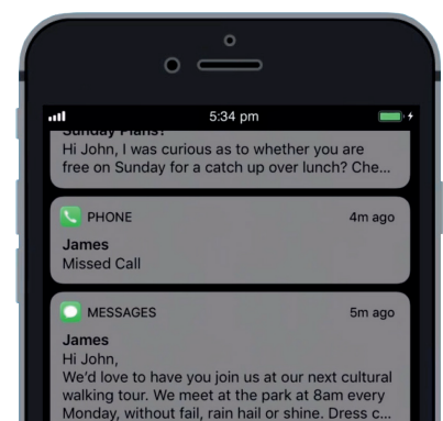
從螢幕頂部向下輕掃 便能開啟通知中心