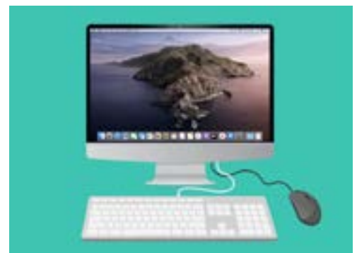
出現桌面的畫面代表設定已完成