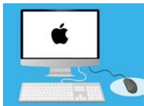
Quý vị đăng nhập vào máy tính bằng mật khẩu