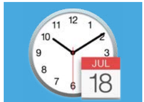
Biểu tượng Ngày & Giờ (Date & Time) mở các tùy chọn để cài đặt thủ công lịch và đồng hồ trên máy tính của quý vị

Khi quý vị hài lòng với ngày và giờ đã chọn, nhấp Lưu (Save) để cài đặt nó.