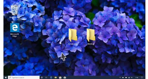
更换桌面背景图片，对电脑进行个性化设置