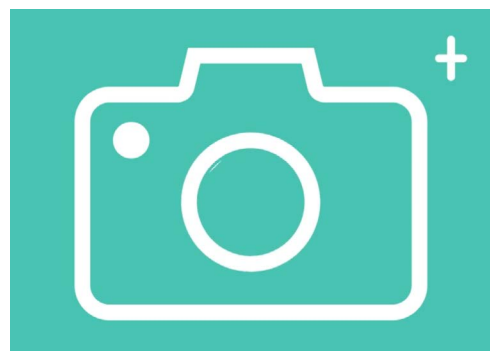
Biểu tượng ứng dụng Camera nằm trên màn hình Home, Khóa (Lock) hoặc Ứng dụng (Apps).

Ứng dụng Camera kích hoạt camera và hiển thị những gì camera có thể thấy trên màn hình điện thoại. Đây được gọi là xem trực tiếp (live view) .