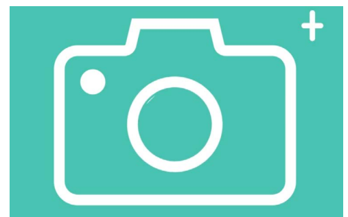
Το εικονίδιο της εφαρμογής Κάμερα βρίσκεται στην οθόνη Home, Lock (Κλειδώμα) ή Εφαρμογές