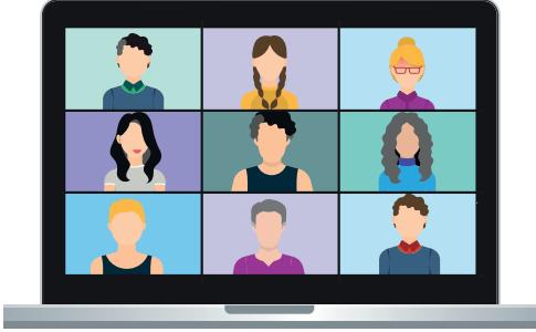
استمتعوا بمكالمات الفيديو مع الأصدقاء باستخدام Zoom