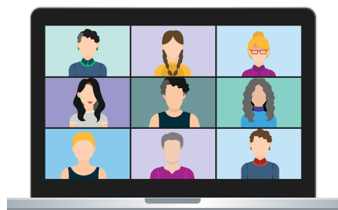
Fai videochiamate con gli amici utilizzando Zoom