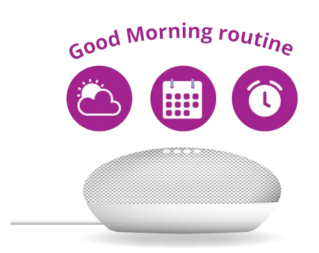
Google助理(Google Assistant) 可以幫助您規劃一天行程