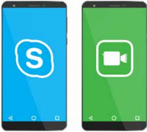
تساعدك تطبيقات Skype و FaceTime في البقاء على اتصال بسهولة