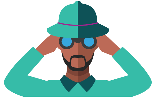
旅行导游不仅仅帮你丰富历史知识