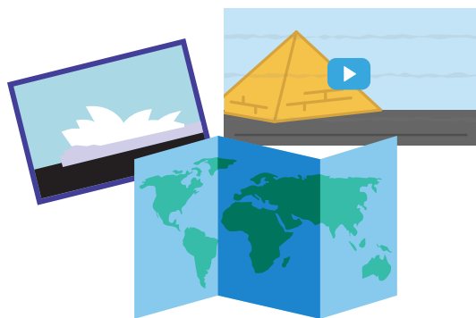
旅行导游使用一系列交互式内容

“看谷歌地球上让人惊叹的图片、视频剪辑、交互式地图以及其它更多内容, 你不禁会有身临其境的感觉。”