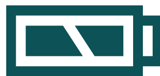
Biểu tượng pin cho biết còn bao nhiêu pin

Cũng giống như máy tính xách tay, máy tính bảng có pin ở bên trong. Điều đó có nghĩa là quý vị có thể sử dụng máy tính bảng mà không cần nối máy với nguồn điện. Quý vị có thể mang theo và sử dụng máy tính bảng chừng nào vẫn còn pin.