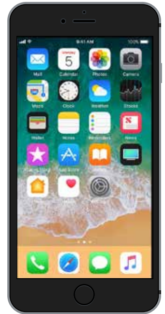
Gõ vào biểu tượng Phone trên màn hình

Không chỉ để gọi điện thoại, điện thoại thông minh còn có rất nhiều chức năng giống máy tính bảng, máy tính xách tay và giờ đây thậm chí còn giống máy tính để bàn. Điện thoại thông minh có thể chạy các ứng dụng và có thể lướt internet trên đó.