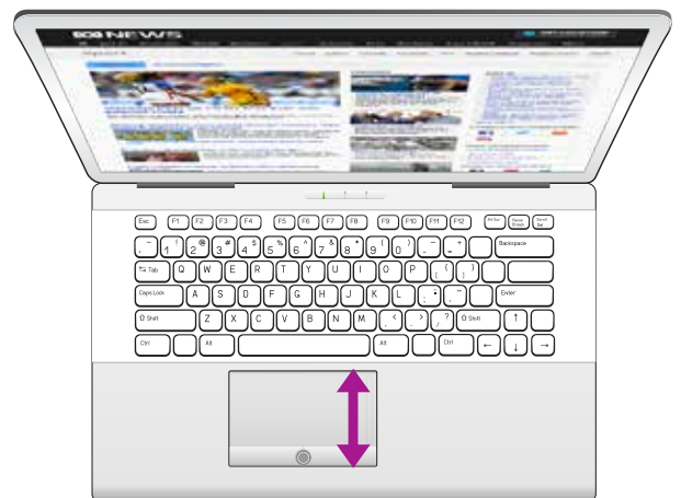
Đây là chuột cảm ứng.