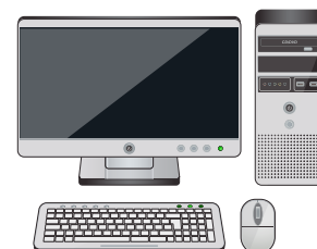
Computadora de sobremesa