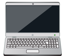
Máy tính xách tay