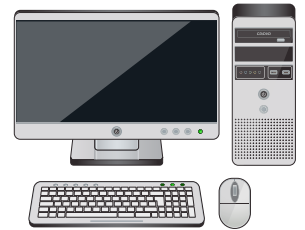
Máy tính để bàn