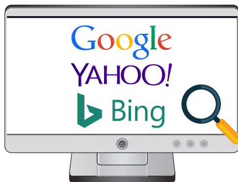
Google, Yahoo και Bing