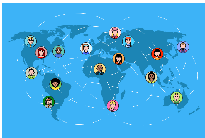
Mantenga el contacto en una red social