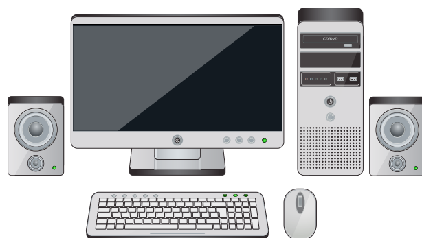
Десктоп компјутерот има повеќе делови