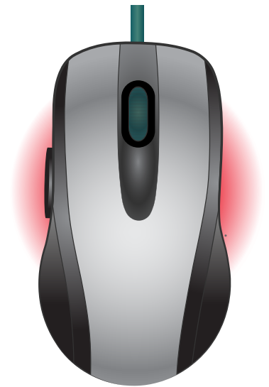
Esto es un ratón

No es tan difícil, ¿verdad? Una vez que domine las funciones básicas del ratón y del teclado, estará listo para empezar la aventura con su computadora.