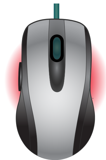
Đây là chuột máy tính

Không quá khó, phải không quý vị? Và sau khi nắm vững kiến thức cơ bản về chuột và bàn phím, quý vị đã sẵn sàng bắt đầu cho chuyến phiêu lưu cùng máy tính rồi!