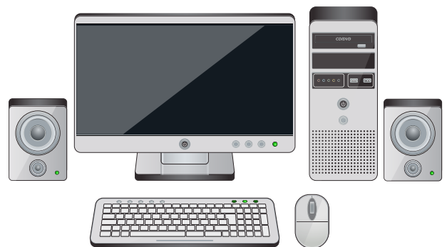
Un computer fisso è composto da più parti