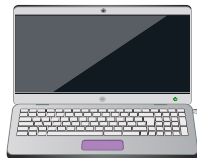
Το touchpad στον φορητό υπολογιστή κάνει την ίδια δουλειά με το ποντίκι