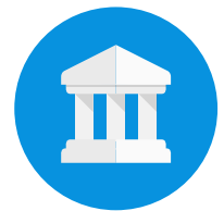
Google Arts & Culture

Дознајте повеќе со Google Arts & Culture и Voyager