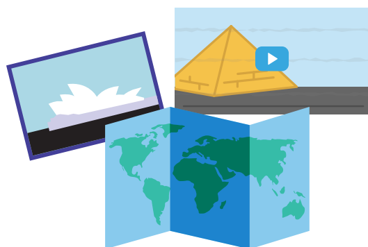
Voyager sử dụng một loạt nội dung tương tác

‘Xem Google Earth trở nên sống động với những hình ảnh tuyệt đẹp, các đoạn video, bản đồ tương tác và nhiều hơn thế nữa.’